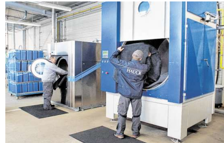
In diesen großen Industriegewaschmaschinen und Trocknern im Ketscher Gewerbegebiet werden die Schmutzfangmatten gereinigt.

„Natürlich können solche Schmutzfangmatten auch in Firmenfarben und mit Logos versehen werden und so neben ihrem Nutzen für einen zusätzlichen Hingucker im Eingangsbereich sorgen“, sagt Doris